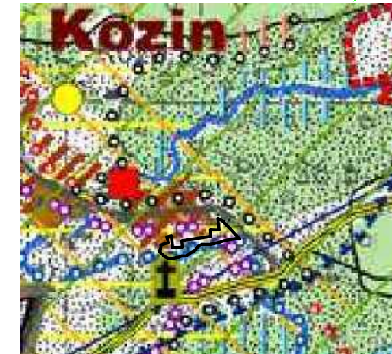
graniczająca linia opracowania planu miejscowego