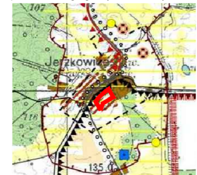
Wrys z studium uwarunkowań i kierunków zagospodarowania przestrzennego gminy Czarna Dąbrówka