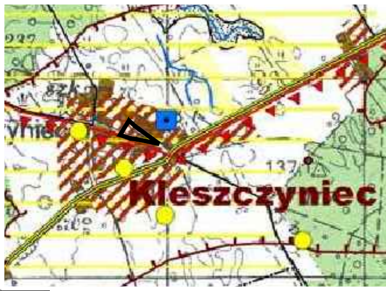
granica opracowania planu miejscowego