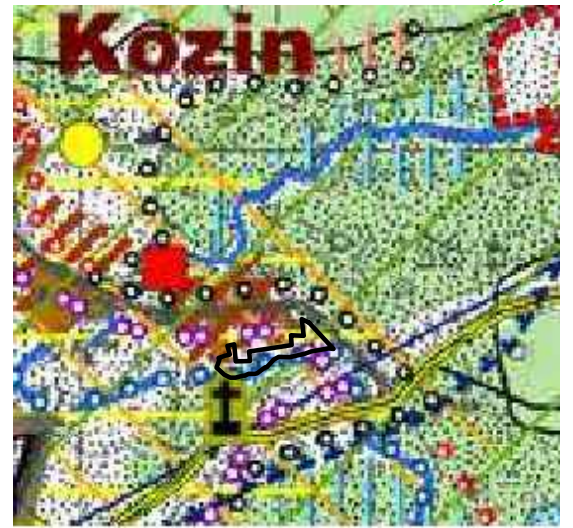
granica opracowania planu miejscowego